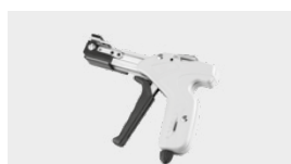
ZACISKARKA DO OPASEK STALOWYCH