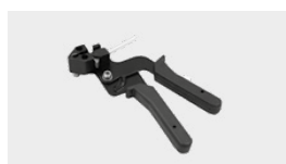
NACIĄGARKA DO OPASEK BALL-LOCK